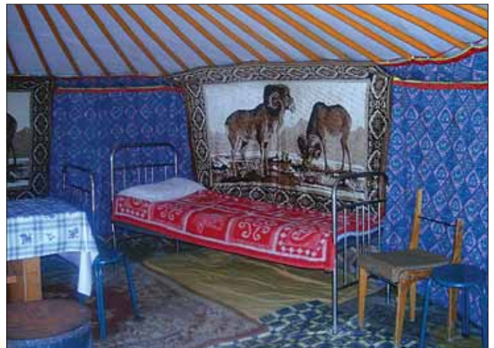
Die Jurten sind warm, die Betten gewöhnungsbedürftig.