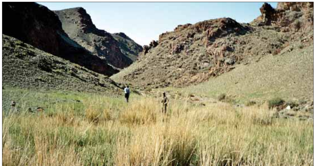
Die Steinböcke liegen sehr hoch in den Hängen. Zum Beobachten und Ansprechen müssen die Jäger über ihnen sein.