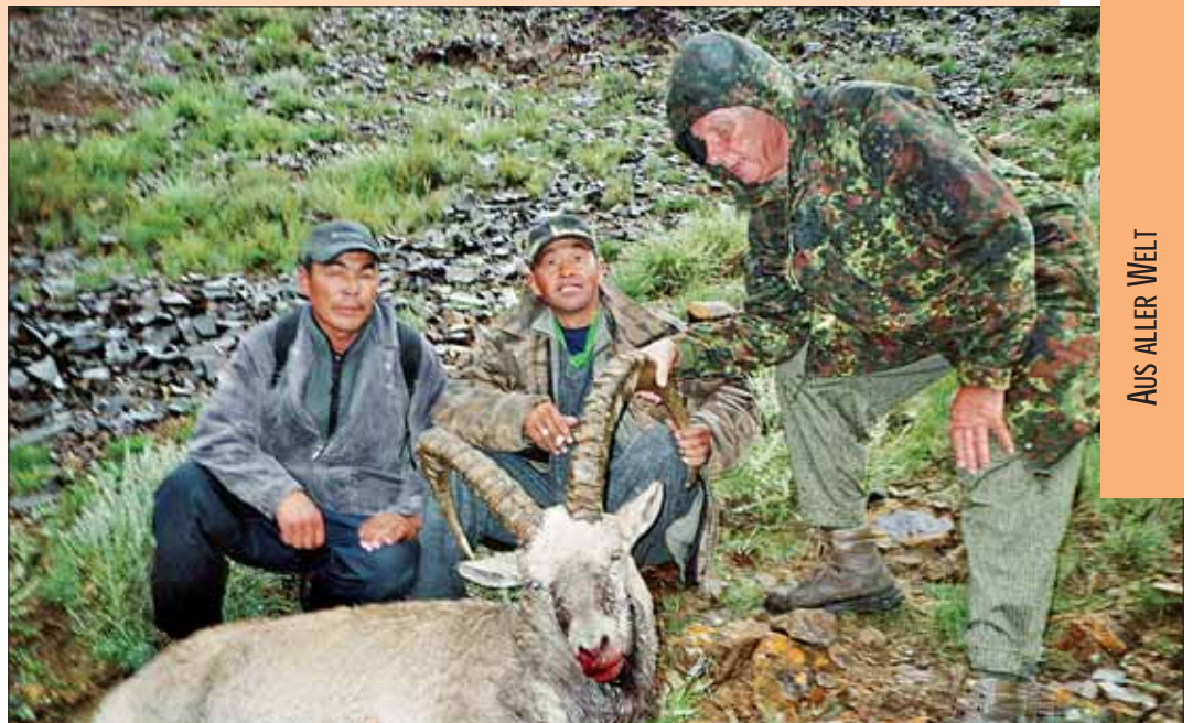
Die Jagdführer und der glückliche Autor mit seinem Steinbock - Schlauchlänge 110 cm.

Ich habe das Haupt mit dem Cape nicht mehr aus der Hand gegeben.