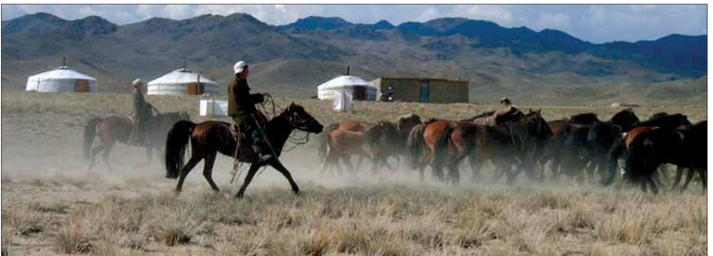
Vorbeiziehende Pferde, riesige Schafherden, Umzugskarawanen mit ihren Herden und Jurten begeistern immer wieder.

Ich dachte, der Fahrer wird nun ausruhen und der Dolmetscher macht sich einen ruhigen Tag, denn das Feuerkommando konnte mir auch der Jagdführer durch Zeichen geben, aber nein, großes Aufgebot in die Berge. Alle bewaffnet mit Optik vom Feinsten für das Museum, und auf ging es in die Höhen des Altai.