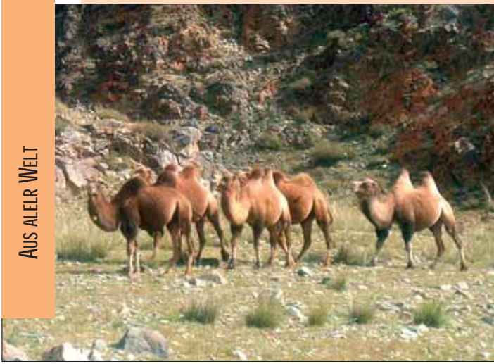
Faszinierend sind die freilaufenden Kamele.