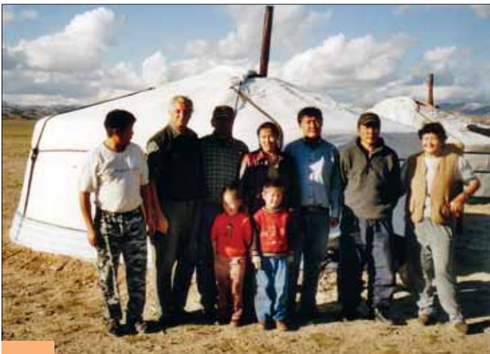
Herzliche Gastfreundschaft der gesamten Mannschaft.

Nur mit dem Aufbrechen waren wir noch nicht weiter gekommen. Mein gutes Jagdmesser lag in Ulaan Bataar beim Zoll in Verwahrung (ich hatte es beim Weiterflug nach Hovd am Gürtel, weil ich dachte, die Kontrolle sei im Inland nicht so streng). Der Dolmetscher besaß kein Messer und der Jäger hatte seines verloren.