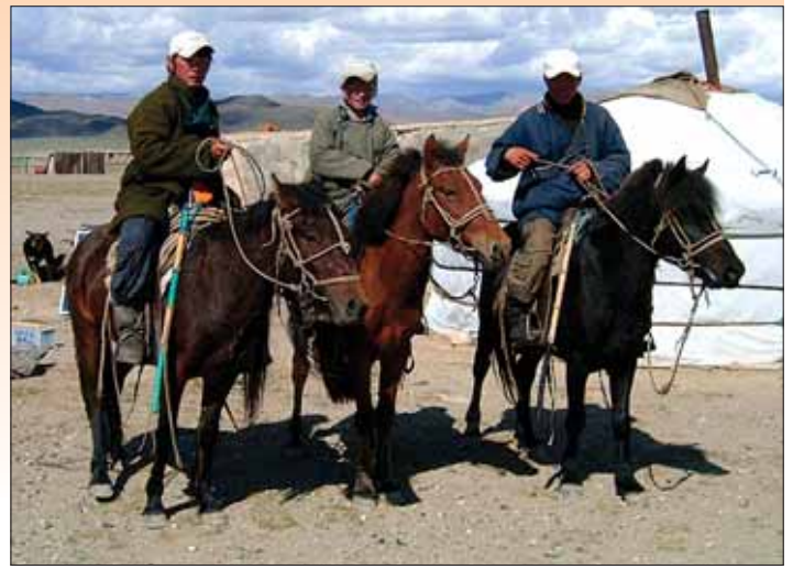
Alle Mann rüsten sich für den Marsch in die Höhe.

Gleiches Spiel wie am Vortag, nur heute etwas trockener. Zwischenzeitlich hatte der alte Bock etwas bemerkt und wurde unruhig. Wir mussten eine große Pause machen, bis er sich beruhigt hatte. Der Jäger hatte immer einen Vorsprung von 400 - 600 Metern zu uns, und zum Steinwild waren noch zwei Bergkuppen dazwischen. Dort angekommen, kam das Kommando zum Fertigmachen. Ich schob mich mit geladener Waffe an eine Kuppe heran, wo mein Rucksack schon als Auflage postiert war. Aufregung pur. Immer kam ich mit dem Kopf zu hoch und wurde vom Jäger nach unten gedrückt. Mit dem Ellenbogen bin ich gleich zwei Mal vom Felsen abgerutscht und musste erst festen Halt finden. Soweit hatte ich alles im Griff. Aber wo war der Steinbock? Er steht neben dem weißen Stein am Hang.