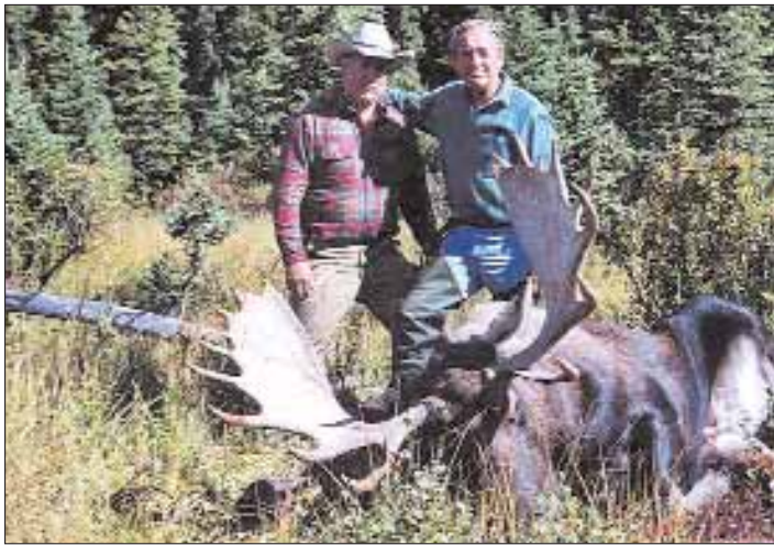
Gast und Guide freuen sich. 51 Inch.