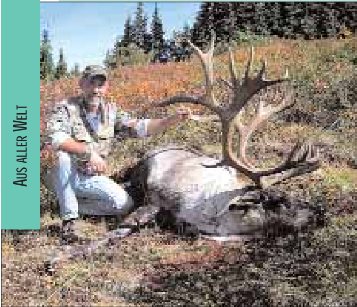
Guide mit Mountaincaribou.