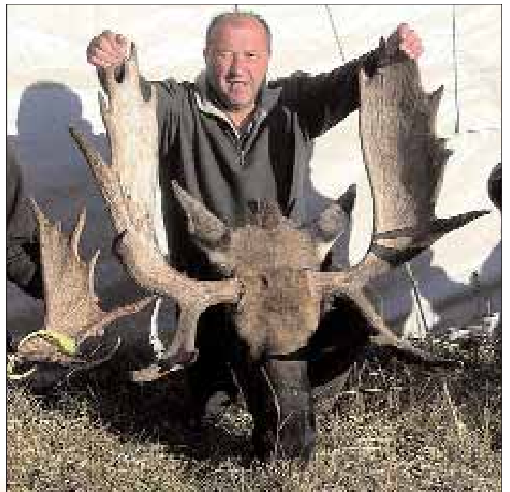
Ein glücklicher Jäger mit gutem 44 Inch Elch.