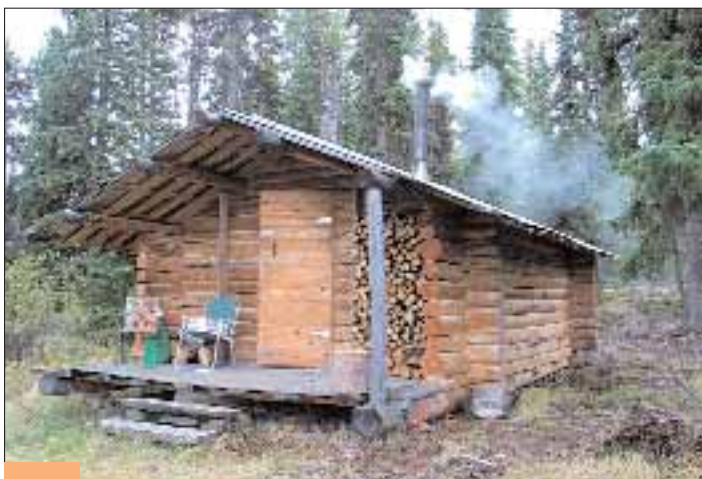
Eine Gäste-Cabin am Hauptcamp.

Nachdem Sie nun im Camp angekommen sind und sich eingerichtet haben, neigt sich der Anreisetag auch bereits seinem Ende zu.