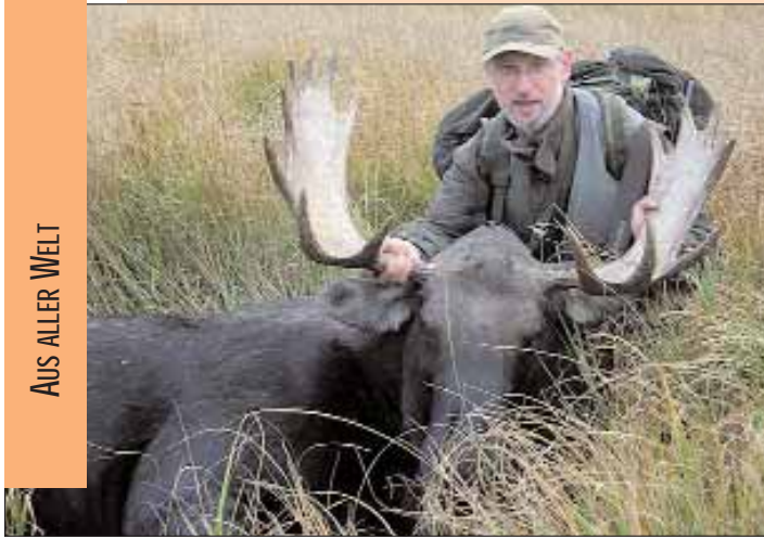
Ein zufriedener Jagdgast mit seinem 38 Inch Elch.