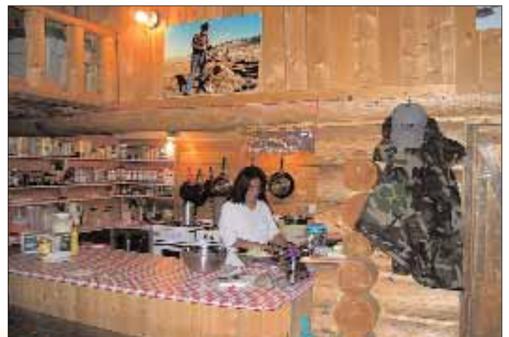
Küche im Haupthaus.